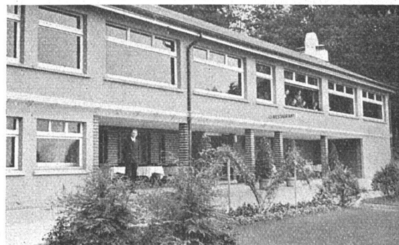
Neubauten auf dem Gurten. Die Besitzung gehört der Stadt Bern. Für 235,000 Fr. sind hier Neu- und Umbauten durchgeführt worden. Die Ostfront gegen die Stadt zu gerichtet. Architektur: Bauinspektorat Bern.