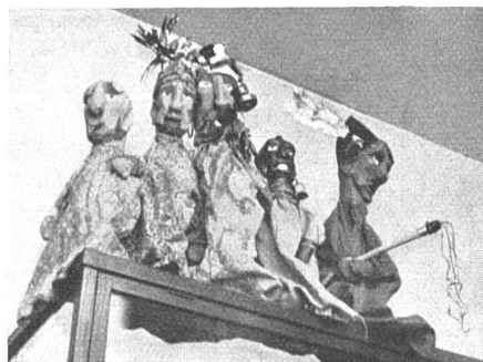
Holz-Marionetten, Bildhauer H. Würgler SWB, Bern

Das Spezialgeschäft für Bauarbeiten in MARMOR und GRANIT