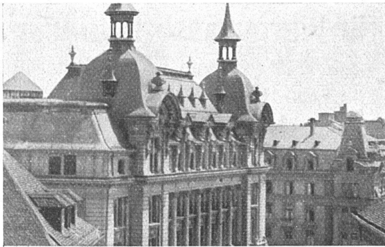
Hauptpostgebäude Bern vor dem Umbau. Der auf diesem Bild nicht sichtbare Hauptturm wird erst in der nächsten Bauetappe abgetragen werden