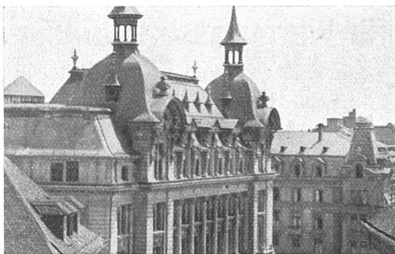
Hauptpostgebäude Bern vor dem Umbau. Der auf diesem Bild nicht sichtbare Hauptturm wird erst in der nächsten Bauetappe abgetragen werden