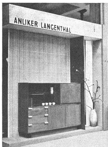
Stand einer Berner Firma. Eine der ganz wenigen Kojen mit sachlich-einfachen Möbeln an der diesjährigen Basler Mustermesse