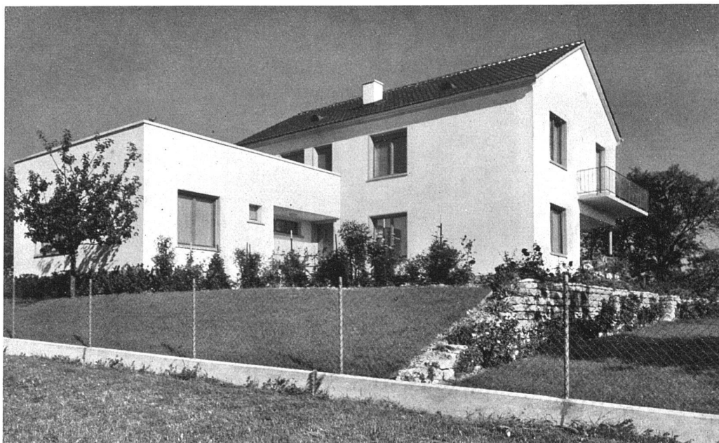
Ansicht von Nordosten