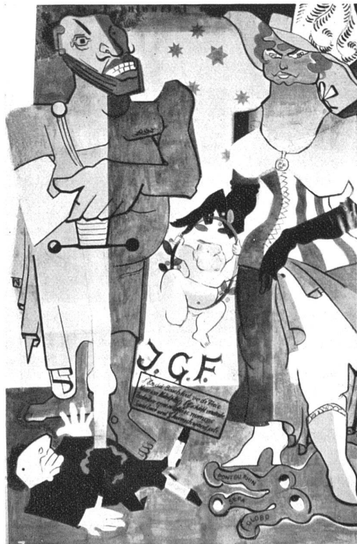
Laterne der «Mittwochgesellschaft», Maler Karl Hindenlang