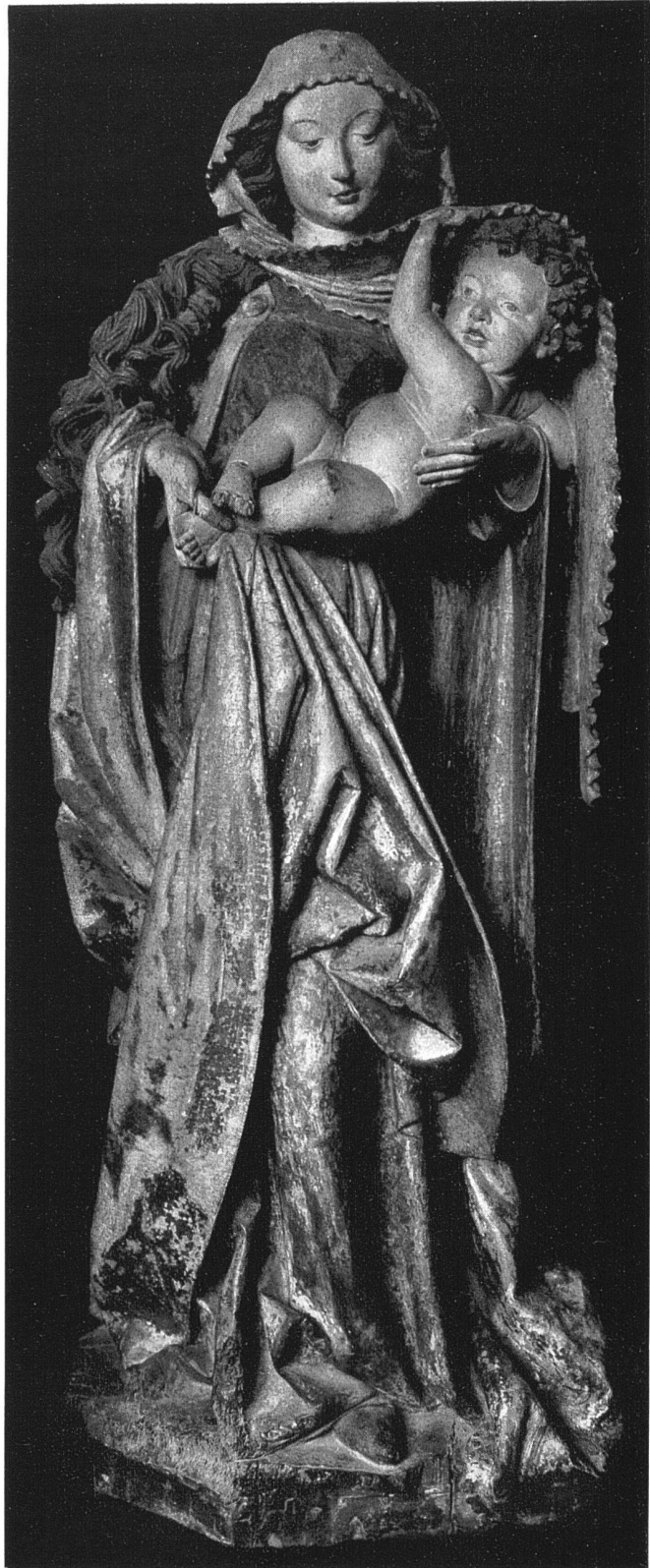
Madonna von Dangsheim (Elsass), um 1490 Nussbaumholz, 105 cm hoch Leihgabe des Deutschen Museums, Berlin