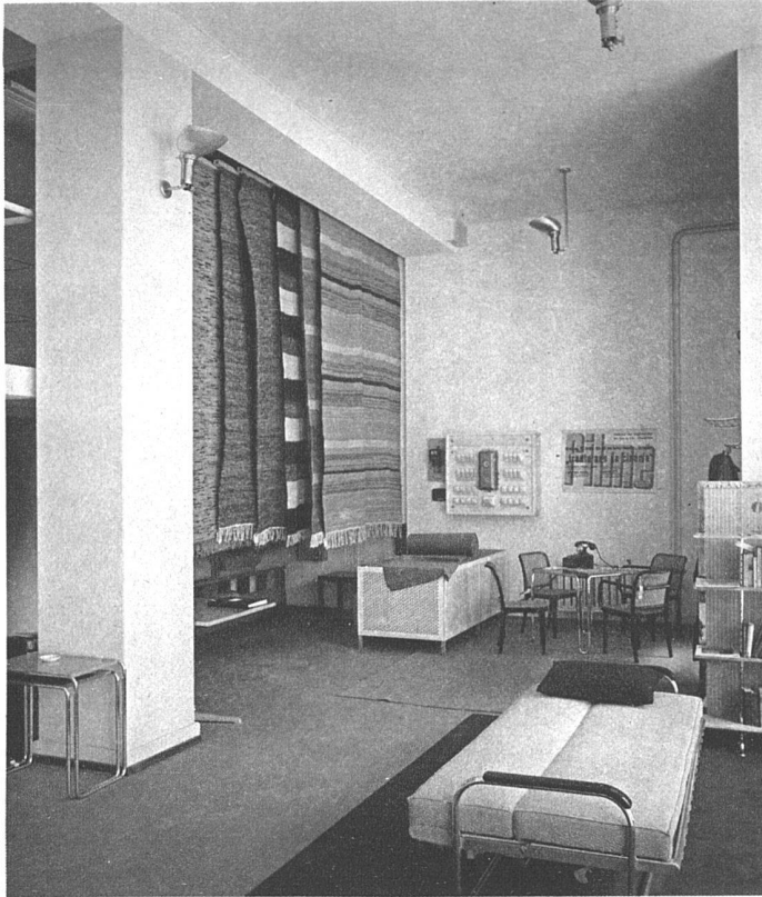
Ladenumbau der Wohnbedarf A.-G., Talstrasse 11, Zürich Architekten Marcel Breuer, Berlin und R. Winkler, Zürich

ohne dass die Wand beschädigt wird. Vorne links Drehgestell für Möbelsstoffe, das den Stoff bereits in gespanntem Zustande zeigt, sodass die gleiche Wirkung für das Auge entsteht, wie nachher beim bezogenen Polster. Rechts die Treppe zur Galerie, die eingebaut wurde, um oben eine komplette Vierzimmerwohnung zu zeigen.