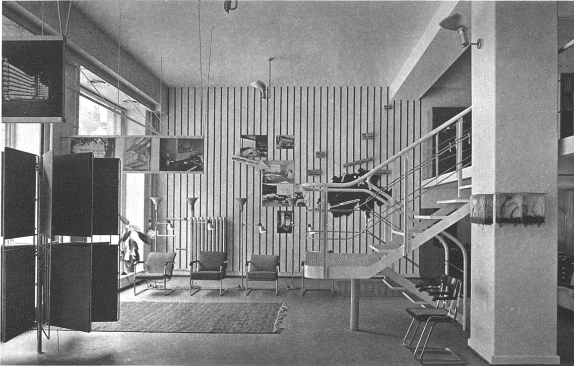
Ladenbau der Wohnbedarf A.-G., Talstrasse 11, Zürich Architekten Marcel Breuer, Berlin, und R. Winkler, Zürich

Durchblick durch den ganzen Laden. Links Vorhanggestell; es werden die Vorhänge wie im Gebrauch gegen das Licht an Schienen hängend gezeigt. Die Beleuchtung des Ladens ist durchwegs indirekt durch verstellbare Strahler