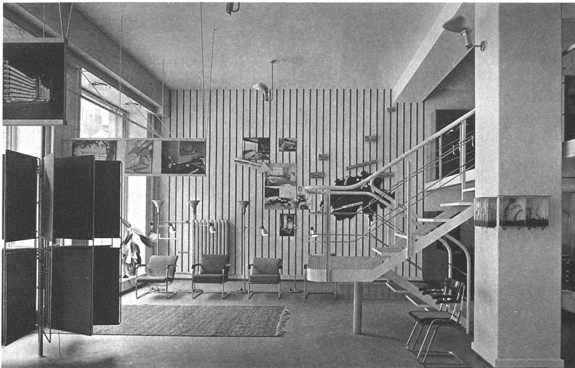
Ladenumbau der Wohnbedarf A.-G., Talstrasse 11, Zürich Architekten Marcel Breuer, Berlin, und R. Winkler, Zürich

Durchblick durch den ganzen Laden. Links Vorhanggestell; es werden die Vorhänge wie im Gebrauch gegen das Licht an Schienen hängend gezeigt. Die Beleuchtung des Ladens ist durchwegs indirekt durch verstellbare Strahler