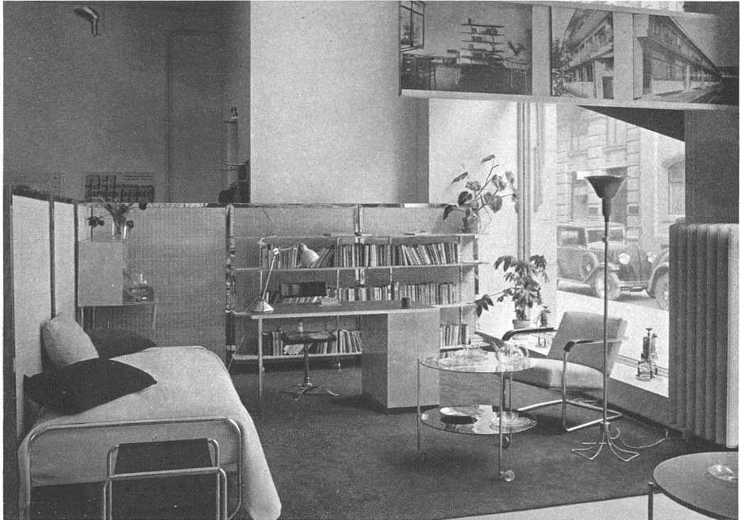
Schaufenster des Ladens

Ladenumbau der Wohnbedarf A.-G., Talstrasse 11, Zürich Architekten Marcel Breuer, Berlin, und R. Winkler, Zürich