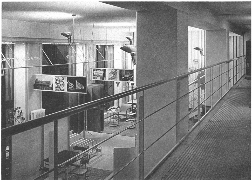
Durchblick von der Galerie auf den unteren Teil des Ladens

Ladenumbau der Wohnbedarf A.-G., Talstrasse 11, Zürich Architekten Marcel Breuer, Berlin, und R. Winkler, Zürich