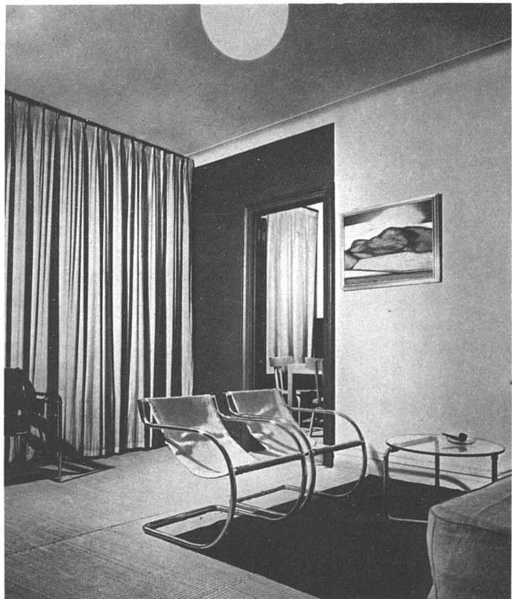
Walter Boermann, New-York Wohn- und Arbeitsraum

Abbildung Seite 223 oben zeigt die hintere Wand des Ladens. Die schwarzen Holzstäbe erlauben das Befestigen von Fotos, Schrift usw.,