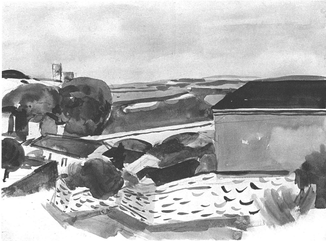
Brücke von Villeneuve-les-Avignons, 1931 31 × 42 cm