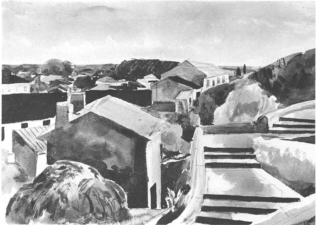
Orange (Südfrankreich), 1931 31 × 42 cm Aquarelle von Adolf Funk, Nidau (Bern) Ebene von Orange, 1931 31 × 42 cm