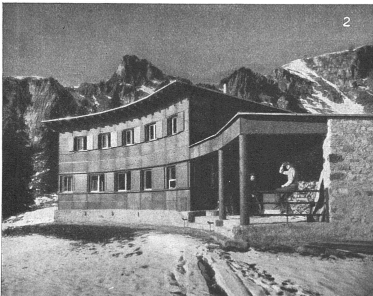
Ski- und Touristenhaus Ortstock über Braunwald. Ardosit-Bedachung (Durotect mit grünem Schieferbelag). Architekt H. Leuzinger, Glarus

die teerfreie Dauerdachpappe ist äusserst widerstandsfähig gegen alle Witterungseinflüsse.