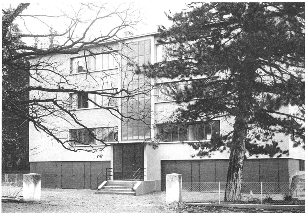
en bas: Côté jardin

parations entre appartements sont constituées par deux épaisseurs de briques de plâtre et une épaisseur de liège. Les radiateurs et toute la tuyauterie sont isolés des murs par des lamelles de plomb, placées sur les consoles ou