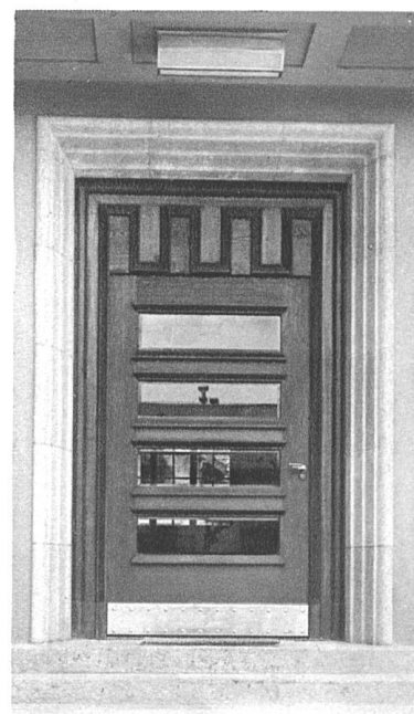
Laiteries Réunies de Genève F. Mezger, architecte FAS, Genève