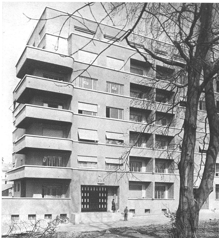
Immeuble de Montchoisy, Genève Maurice Braillard, architecte FAS, Genève

Tous les locaux de la centrale laitière réclamaient une grande étanchéité des sols et des matériaux résistant aux acides lactiques, à l'eau chaude et au roulement des boilles et des chariots. Les dalles et partiellement les parois ont été isolées par une émulsion de Mamouth puis recouvertes par des briques de 5 cm. d'épaisseur en grès vitrifié fabriqués spécialement par l'Usine de Beujin (Pas de Calais). Ce matériau a donné jusqu' alors entière satisfaction.