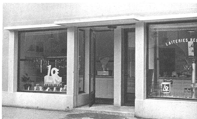
en haut: Fromagerie en bas: Magasin de vente