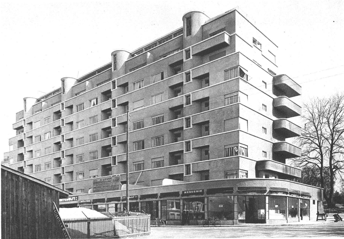
Immeuble Groupe 1 Square B de Montchoisy, Genève Maurice Brailard, architecte FAS, Genève