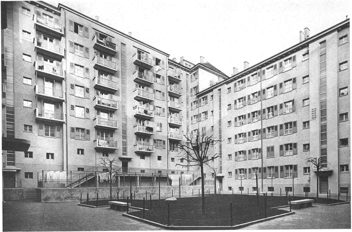
Vue de la cour, angle nord-est