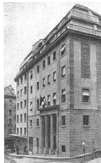
Genève la nouvelle maison de l'Armée du Salut, rue Verdaine Ed. Fatio, arch. FAS

Ces Messieurs sauront certainement voir l'avantage évident que présente le projet de loi pour l'intérêt général de notre ville.