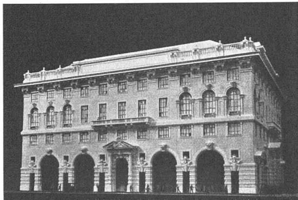
PALAZZO NAFTA, GENUA (ITALIEN) der Soc. Anon. Immobiliare Nafta. Architekten: Fossati & Ginatta