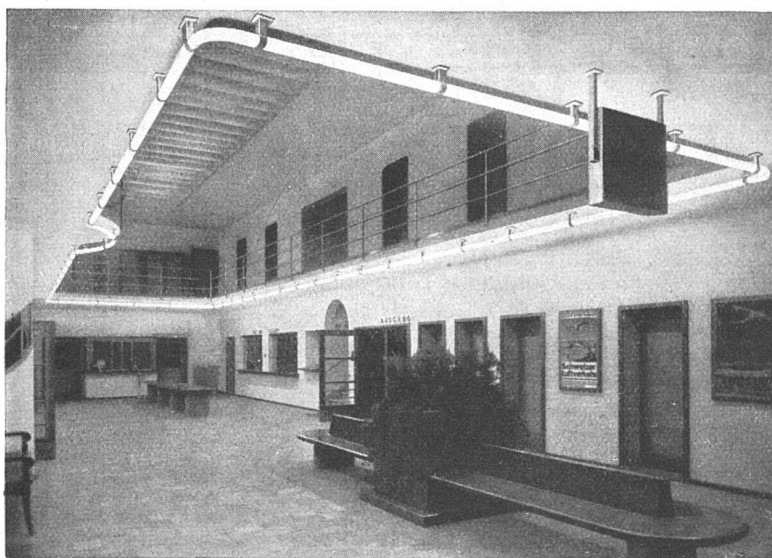
Abfertigungshalle im Aufnahmegebäude Flugplatz Dübendorf. Deckenbeleuchtung mit Osram-Linestra.

OSRAM-LINESTRA werden unmittelbar an das Netz angeschlossen, ohne Zwischenschaltung irgendwelcher Apparaturen.