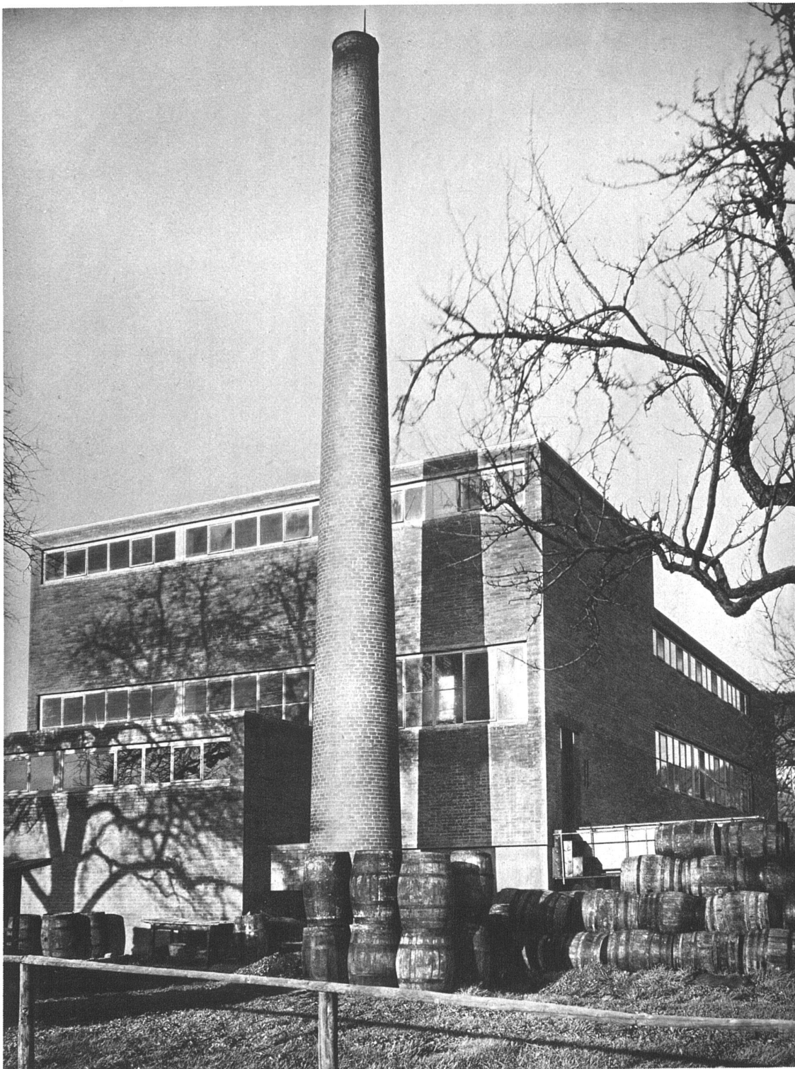
Seifenfabrik Kolb, Zürich 5, Förrlibuckstrasse Erbaut 1928/1929 Südostseite Architekten Kellermüller und Hofmann BSA, Zürich und Winterthur Im Haupttrakt zwei Büros, Fabrikationsräume, Packräume, Abwartwohnung; im hohen Trakt Siedehaus; im Keller Lagerräume; im niedrigen Anbau Kesselhaus und Garage Konstruktion: Eisenbetonständerbau mit Backsteinausfachung