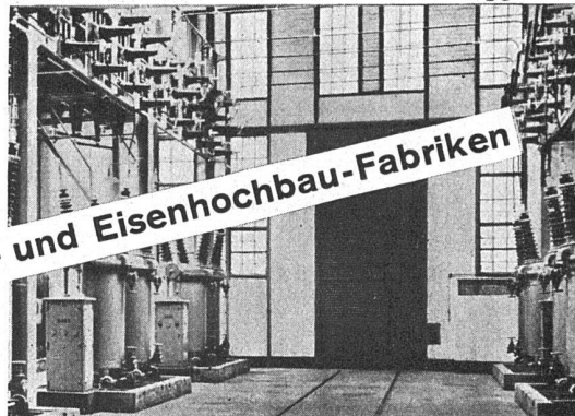
Zentrale Rempen der AG. Kraftwerk Wäggital

Verband Schweiz. Brückenbau- und Eisenhochbau-Fabriken Zürich, Biberlinstrasse 38, Telefon 43.071