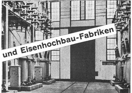
Verband Schweiz. Brückenbau- und Eisenhochbau-Fabriken