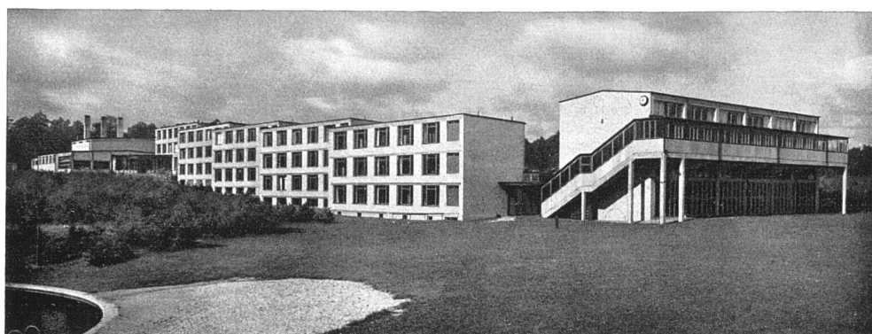
Schule des Deutschen Gewerkschaftsbundes, Bernau bei Berlin Architekt Hannes Meyer, Dessau

beständigen Ausblicks ins Freie auch während der Schulstunden nicht nur unnötig, sondern schädlich. Geistige Arbeit verlangt Konzentration, also intensive unabgelenkte Beschäftigung mit einem einzelnen Gegenstand. Für das Turnen schaffen wir geräumige Turnsäle, Spielplätze, die Licht, Luft, die nötigen Geräte, kurz eben das Optimum und das Maximum aller Erleichterungen bieten. Es ist nicht einzusehen, warum nicht auch für die Beschäftigung mit geistigen Gegenständen das Optimum dessen gesucht wird, was gerade diese Tätigkeit erleichtert. Man ist aber heute vielleicht etwas unbesehen dabei, auch die eigentlichen Unterrichtsräume mehr nach den Grundsätzen auszubilden, die für Turnhallen richtig sind. Gerade ein aufnahmefähiges, gewecktes Schulkind wird durch die Möglichkeit des beständigen Ausblicks davon abgelenkt, sich auf den Lehrgegenstand zu konzentrieren. Man hört behaupten, ein idealer Lehrer müsste auch dann imstande sein die Aufmerksamkeit zu fesseln, und es ist möglich, dass ihm das in seinen besten Augenblicken bei den meisten Schülern wirklich gelingt. Man kann aber zur Not gewiss auch im Wintermantel turnen: so gut wir hier aber alles vermeiden, was die beabsichtigte Tätigkeit erschwert, so sollte auch alles vermieden werden, was die nötige Konzentration bei geistiger Arbeit erschwert. Gegen die hygienischen Forderungen ist damit nicht das