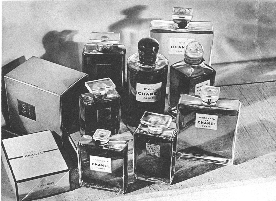
Französische Parfumerie-Flacons und -Packungen