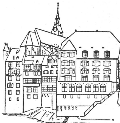
oben: heutiger Zustand; unten: das abgelehnte Neubauprojekt

lichsten Punkte brutal zerstört würde. Wenn man auch im einzelnen heute nicht mehr so bauen würde wie die Con- fiserie Spillmann erbaut wurde, so muss man doch aner- kennen, dass Architekt Fäsch seinerzeit die Baumassen mit untadeligem Gefühl abgewogen hat, und dass hier der Erker links sehr geschickt den Charakter der schma- len, hohen, links anschliessenden Häuser in den Bau- körper des Neubaus aufnimmt, womit vermieden wird, dass dieser zu massig wirkt. Das Neubauprojekt lässt jede derartige Rücksicht vermissen. Wir hoffen, dass die Aktion Erfolg hat, nur wäre wünschenswert, dass die städtebaulichen Bestimmungen für derart ausserordent- liche Situationen von vornherein generell festgesetzt wür- den und nicht erst im «Ernstfall», wo dann jeder der- artige Eingriff für Bauherren wie Architekten notwen- digerweise schikanös wirken muss. Red.