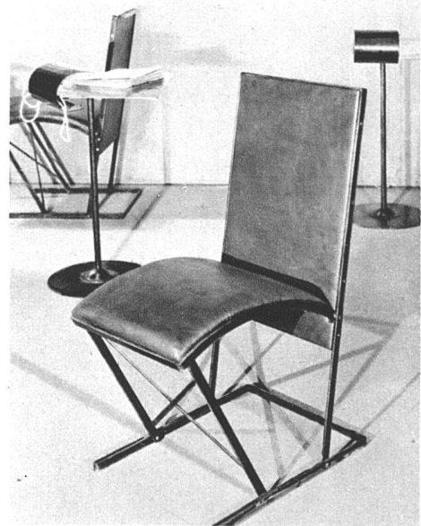
Büchergestell aus Nussbaum poliert und Metall, Sofa und Stühle Metall und blaues Leder. Metalltischchen mit anmontierter Beleuchtung

Diese stark «blecherne» Einrichtung ist gewiss nicht als Sachlichkeit ernst gemeint, sympathisch ist ihre Harmlosigkeit, sie ist bewusst spielerisch-modern, ohne das Modernitätspathos so vieler anderer Metallmöbel. Dieses Informationsbureau über Theaterveranstaltungen hat selber etwas von einer Bühnenausstattung. pm.