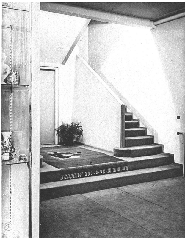
Modésalon Myrbor, Paris Architecte André Lurçat, Paris