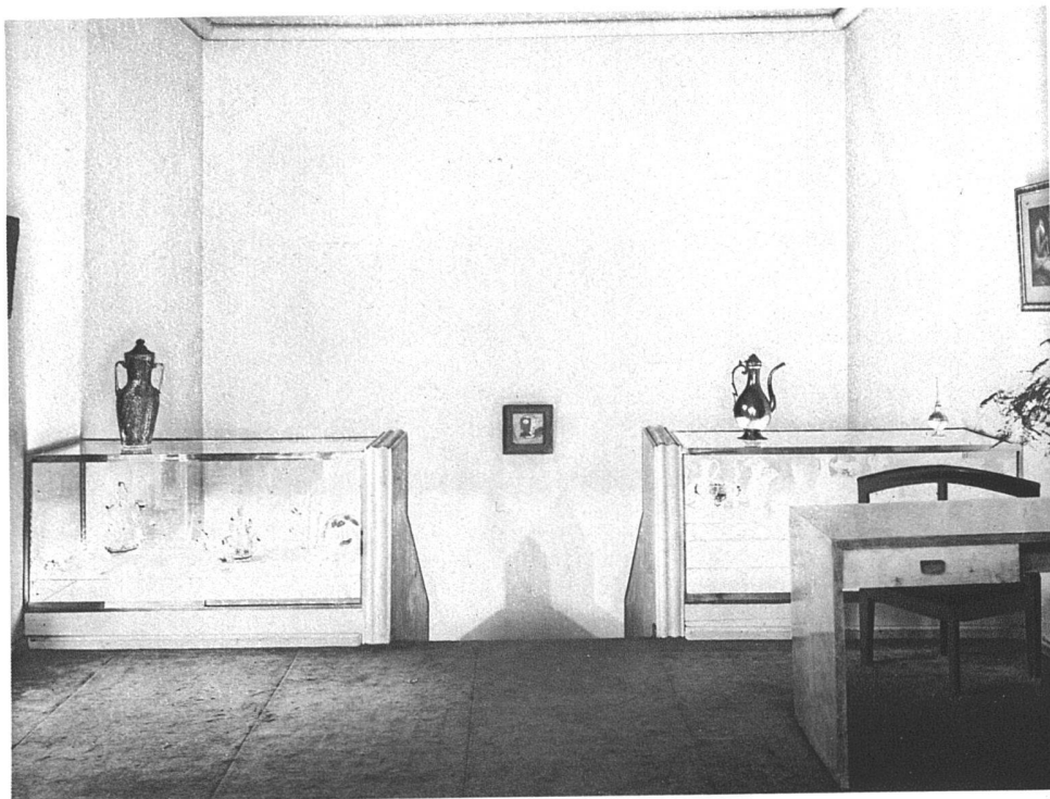
Modesalon Myrbor, Paris Architekt André Lurçat, Paris