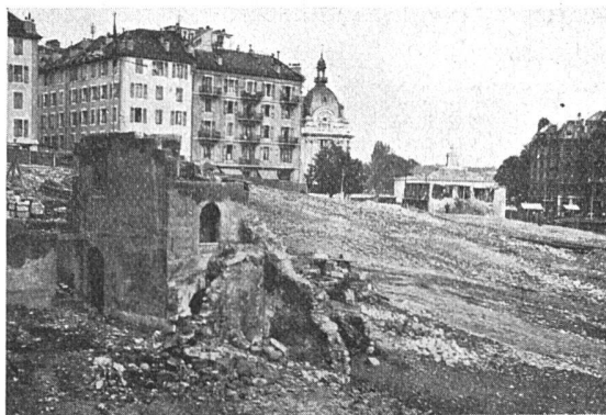
Fin des démolitions du Quai du Seujet, Genève

Jusqu'au 30 décembre 1931, les concurrents pourront demander, par écrit, des renseignements complémentaires au programme; les demandes seront adressées à la Di-