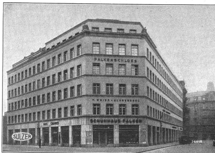
Wohn- u. Geschäftshaus „Falkenschloss“, Zürich, Sulzer Pumpen-Warmwasserheizung und Warmwasserbereitung; Kessel mit Oelfeuerung Ausgeführt durch Gebrüder Sulzer, Aktiengesellschaft, Winterthur, Filiale Zürich, Hobelgasse 9