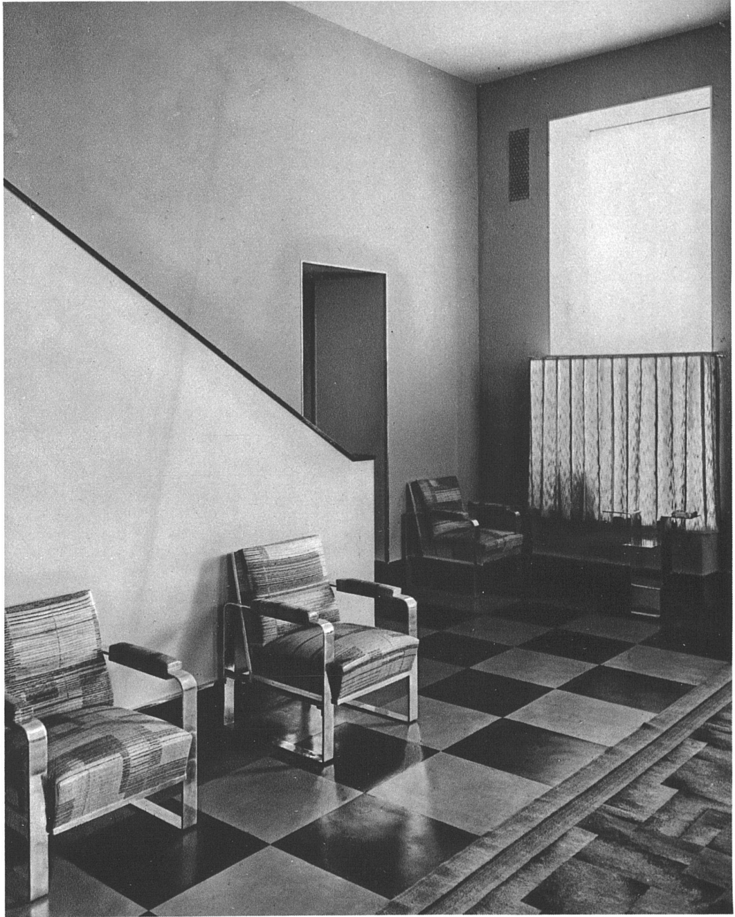
Salon de Couture Guyonnet, 32, Grand-Quai, à Genève Ad. Guyonnet, architecte FAS, Genève