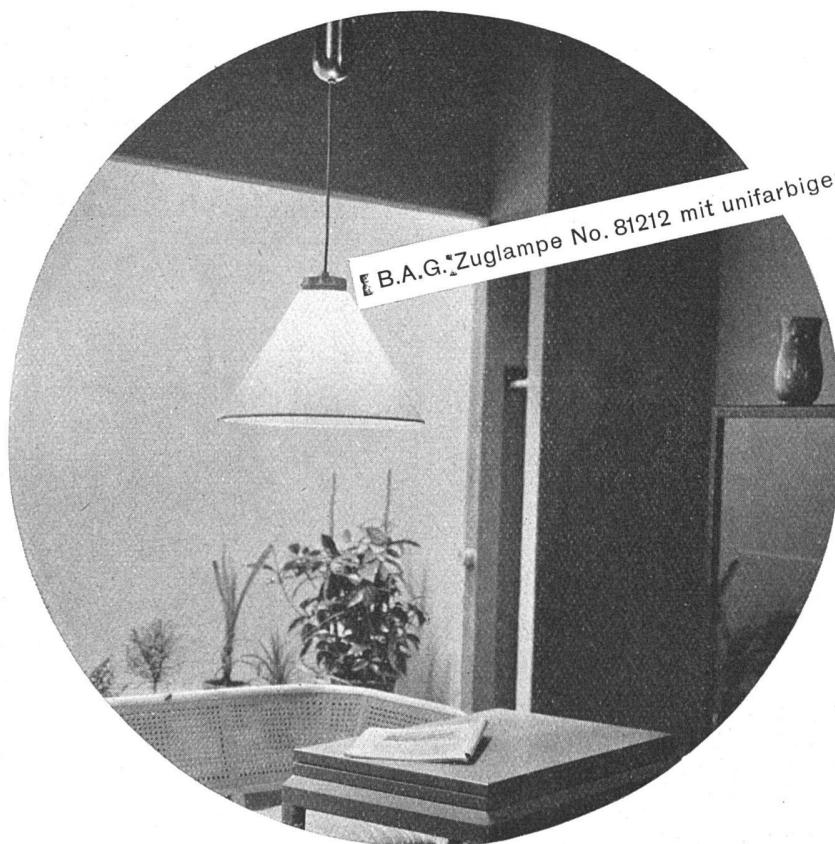
B.A.G.-Zuglampe No. 81212 mit unifarbigen Pergamentschirm Fr. 42.-

B.A.G.-Lampen strahlen ein blendfreies, nie ermüdendes Licht. Jede B.A.G.-Lampe wirft genau den ihrem Zweck entsprechenden Lichtkegel.