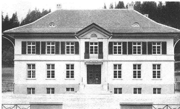
Schulhaus in Gohl Architekt Ernst Mühlemann BSA, Langnau

Wohnhaus im klassischen Typus, wie er in wohlhabenden Kreisen immer noch sehr beliebt ist. Die klassische Form ist hier bei grosser Baumasse und freier Lage «möglich» im Gegensatz zu städtischen Villenquartieren. Auch ist die Anmassung, die in den zeremoniellen Formen liegt gemildert durch die Diskretion ihres Vortrags.