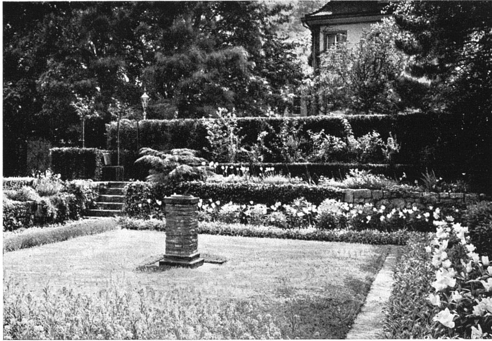
Wohngarten J. Schweizer in Glarus

chitektonisch geformten und absichtlich romantisch wuchernden Partien, sei es durch strenge, aber unaufdringliche Komposition des Ganzen, die dem lebensprühenden Reichtum der Blumen nur zu um so schönerer Geltung verhilft, ohne als Zwang in Erscheinung zu treten. Unser Hausgarten ist die Wohnung im Freien für die Familie, mit Sitzplätzen für alle Tages- und Jahres-