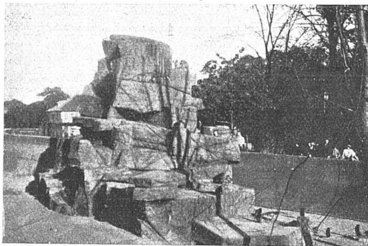
ZOO IN BASEL AFFENZWINGER