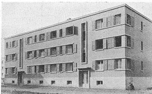
La cité-jardin du Bachet-de-Pesay, Genève (en construction) Dosso et Perrin, architectes

L'implantation des bâtiments est remarquable: toutes les chambres sont bien orientées. Elles ont le soleil, soit le matin, soit l'après-midi. Les fenêtres sont assez grandes; les escaliers sont éclairés par de longues baies verticales; les bâtiments sont couverts en terrasse. Certes, les façades