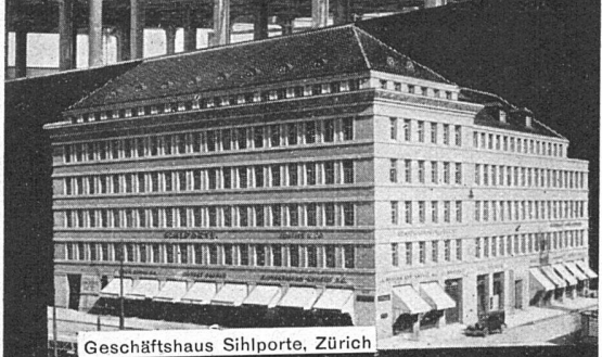
Geschäftshaus Sihlporte, Zürich