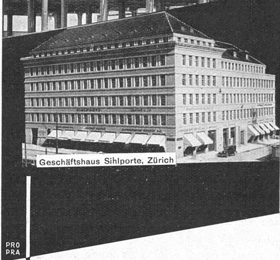
Geschäftshaus Sihlporte, Zürich