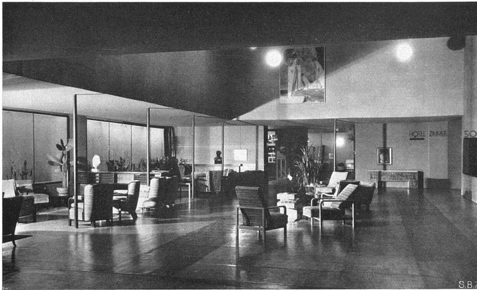
WOBA-Hotel Die Hotelhalle Kristallglaswand Möbel entworfen von Hans Buser S.W.B. Linoleumboden