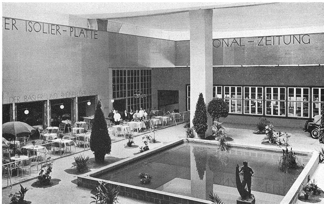
WOBA-Hotel Architekten: A. R. Strässle, F. Bräuning und H. Leu, Mitarbeiter A. Dürig, sämtliche in Basel Der Hotelgarten Bassin gemauert mit «Dreikammersteinen, System Hossdorf» Verkleidung der Wände mit Insulite-Platten Terrasse mit Lausener Klinkern Sissacher Eisenmöbel Hinter den Öffnungen links das Restaurant, hinter den grossen Fenstern das Café-Dancing, rechts der Speisesaal Farben: verschiedene Stufen von Hellrot, Decke hellblau