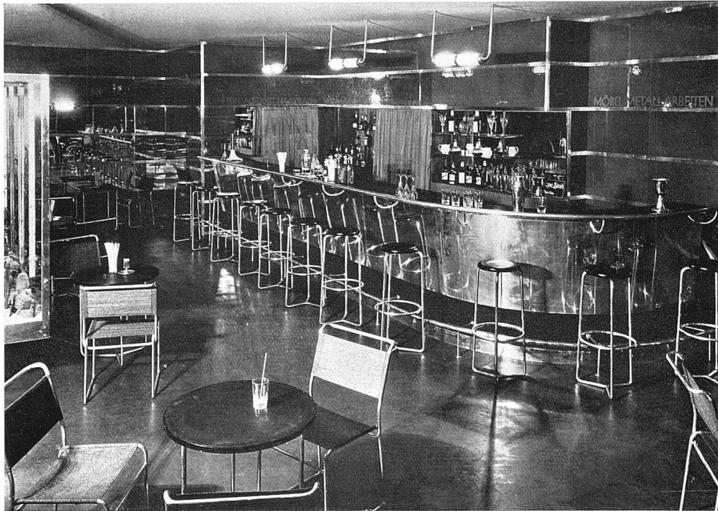
WOBA-Hotel Architekten: A. R. Strässle, F. Bräuning und H. Leu, Mitarbeiter A. Dürig, sämtliche in Basel oben: Bar Wand belegt mit roten Marbrit-Glasplatten Stühle Metall und schwarz Boden graues Linoleum, uni unten: Eingang zum WOBA-Hotel vom Hotelgarten aus Weitere Aufnahmen des WOBA-Hotels sowie ein Grundriss der gesamten Anlage finden sich in Nr. 10, Band 96 der «Schweiz. Bauzeitung» vom 6. September 1930