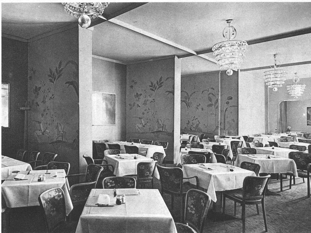
ZIKA Internationale Kochkunst-Ausstellung Zürich Das deutsche Restaurant Architekten Fritz August Breuhaus, Düsseldorf, und Vogelsanger & Maurer B.S.A., Zürich und Rüschlikon Resedagrüne Tapeten, zum Teil gemustert in Graugrün und Hellrot, Stühle mit geblumtem Stoff von gleichen Farben bespannt, Leuchtkörper in weissem Metall und weissem Glas, die Bestuhlung der ovalen Insel dunkelbraun