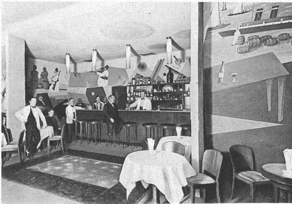
Bar des französischen Restaurant ausgemalt von Adolphe Schnider, Zürich