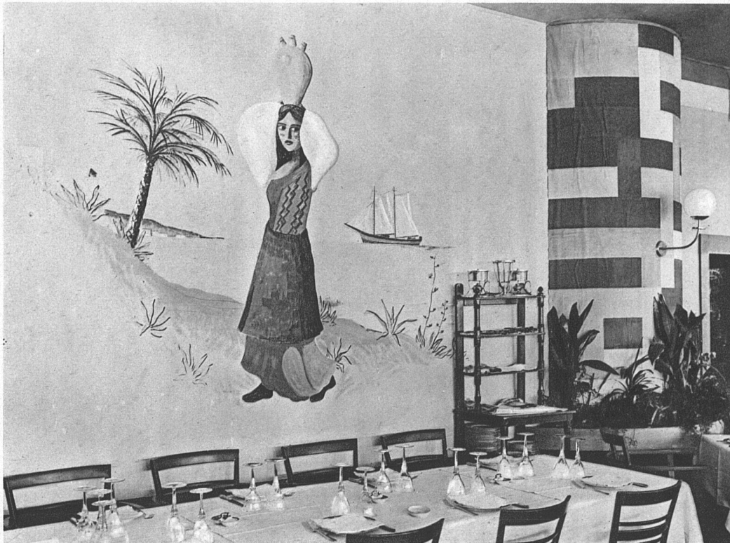
ZIKA Internationale Kochkunst-Ausstellung Zürich Architekten Vogelsanger & Maurer B.S.A., Zürich und Rüschlikon oben: Das italienische Restaurant Wandmalerei von Christian Schmidt S.W.B., Zürich Wände hell-seegrün Bodenbespannung indischrot, Mittelfeld in Cipollino-Marmor unten: Die Fischerstube Wandmalerei von Heinrich Müller, Thalwil Die Wände in verschiedenen stumpfen Tönen von Blau, dazu bräunlichgraue Netze, gleiches Bräunlichgrau in der Malerei, mit sparsam verwendetem Lachsrot, Boden Expanko-Korkparkett braun und schwarz, Bestuhlung dunkel gebeizt