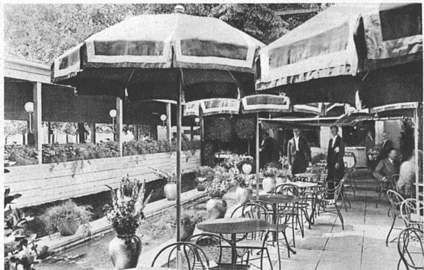
Garten des Schweizer Restaurant innen rot, aussen blau gestrichen hellgelbe Bestuhlung unter roten Schirmen