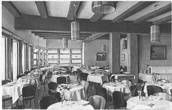
Französisches Restaurant dunkelbraune Holzbalkendecke und Wandgliederung in altnormännischem Stil blaurote Bodenbespannung lachsfarbene spritzlackierte Stühle

Von Wasser berieselte, abends beleuchtete Glaszylinder als Abschluss des Kochkunst-Pavillon