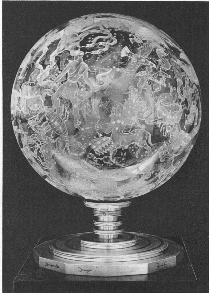
Himmelsglobus mit eingravierten Sternbildern Entwurf Gate Glashütte Orrefors-Bruk