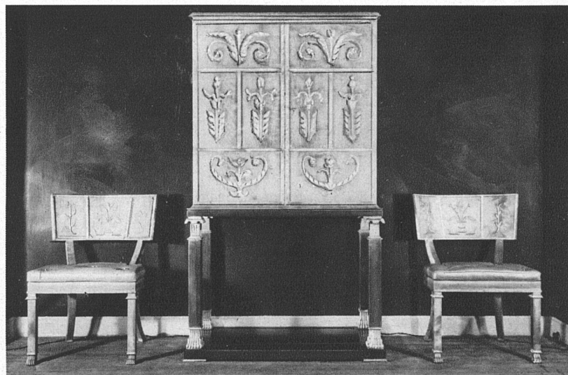
Urkundenschrank mit Schnitzerei aus graupatiniertem Birkenholz Entwurf Malmsten, Nordiska Kompanie