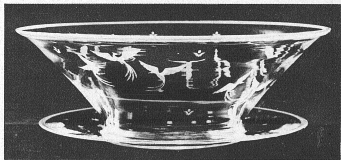
Gravierte Schale mit Untersatz Entwurf Edward Hald Glashütte Orrefors-Bruk