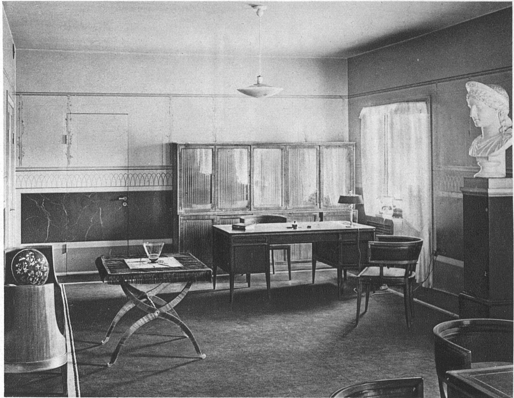
Stadtbibliothek Stockholm Dienstraum des Bibliothekars Architekt Asplund