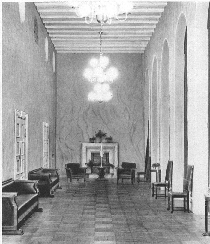
Wandelhalle vor dem Speisesaal des Odd-Fellow Freimaurer-Ordensgebäudes in Stockholm Möbel aus gebohnter Eiche mit Lederbezug