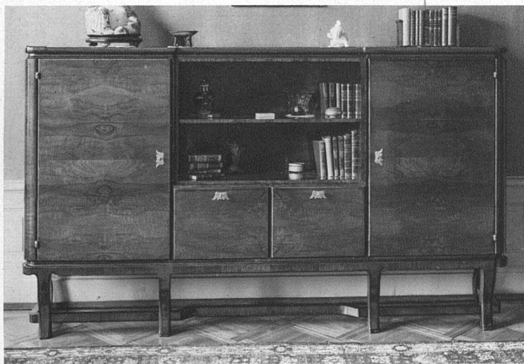
Büchermöbel in Nussbaum-Stockmaser, orange-goldfarbig, gebeizt und poliert, innen italienisch Nussbaum hell Altsilberbeschläge