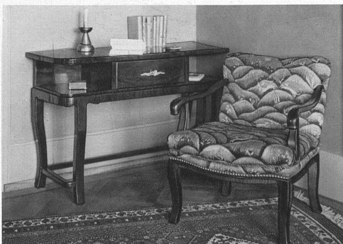
Büchertisch mit Schublade und zwei Nischen, in Nussbaum-Flammenmaser Stuhl Nussbaum mit englischem Gobelinstoff bespannt (gelb, grün, schwarz)