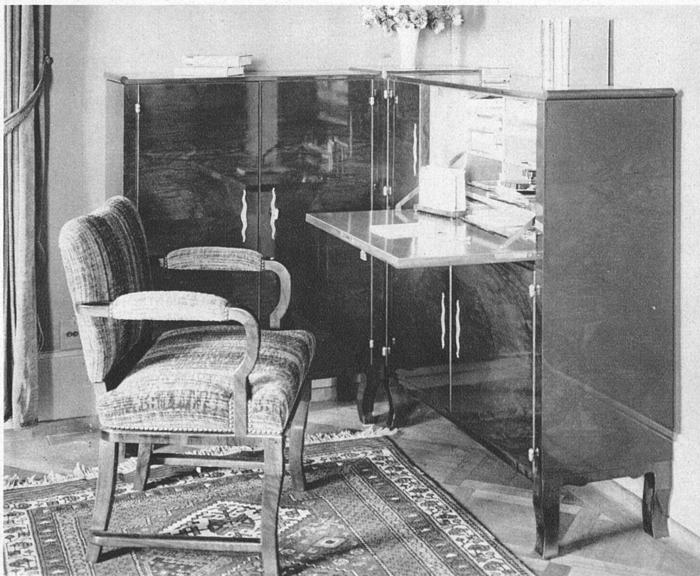
Möbel von Charles Allemann, Innenarchitekt, Zürich Schreibschrank und Kästchen in der Ecke in Nussbaum-Flammenmaser Inneres goldfarbener Ahorn