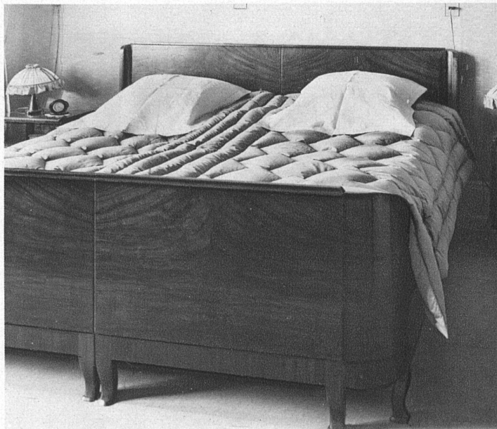
Betten in kaukasisch Nussbaumholz, stark gestreifter Flammenmaser in breiten Fourniertafeln, graugold bis grau-braunschwarz