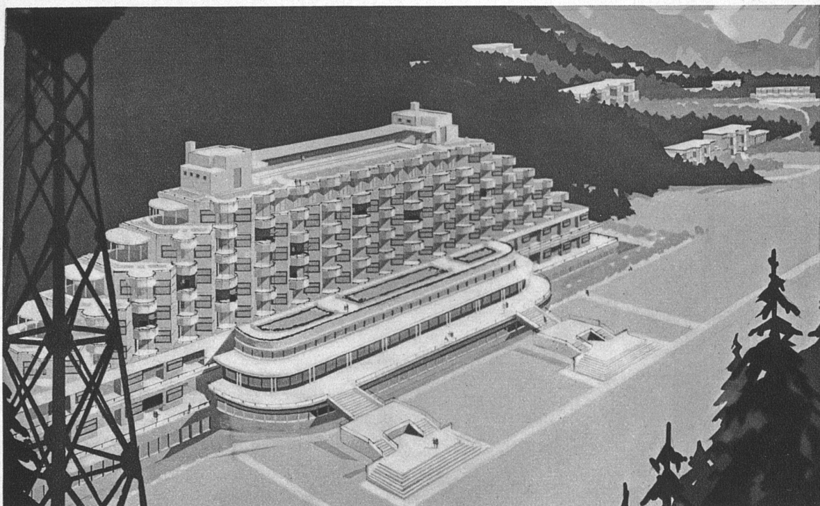
Lungenheilanstalt Plaine-Joux-Mont-Blanc (im Bau) Architekten Pol Abraham und Henry Le Môme oben: Ansicht der Gesamtanlage mit den Einzelpavillons unten: Grundriss eines Appartements

Das hier abgebildete Hauptgebäude enthält 120, sämtlich nach Süden gerichtete Krankenzimmer mit Einzel-Liegebalkon; die Gliederung der Südfassade ergibt sich aus dem Grundriss der Einzelzimmer, für die möglichst