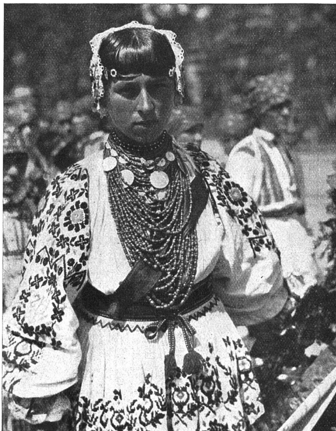
Kroatische Bäuerin aus der Umgebung von Zagreb / Aus «Atlantis»

So durchstreift ein jedes Heft einen Teil der Welt, bei Einzelheiten verweilend oder auf grosse und grösste Zusammenhängeweisend, in Bildern aus der Gegenwart und vergangener Zeiten. B.