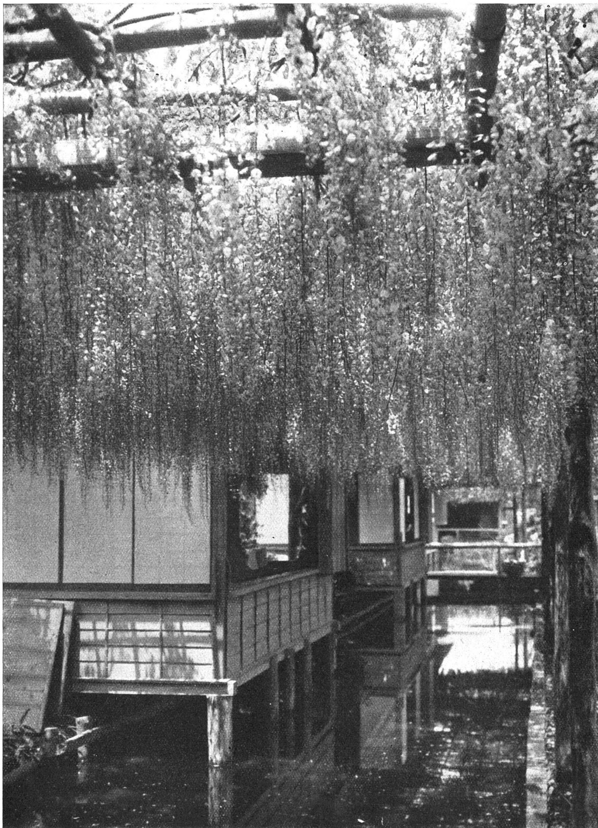
KANATA, TEEHAUS IM GARTEN MIT BLÜHENDEN GLYZINEN / Aus Heft 3 der «Atlantis»