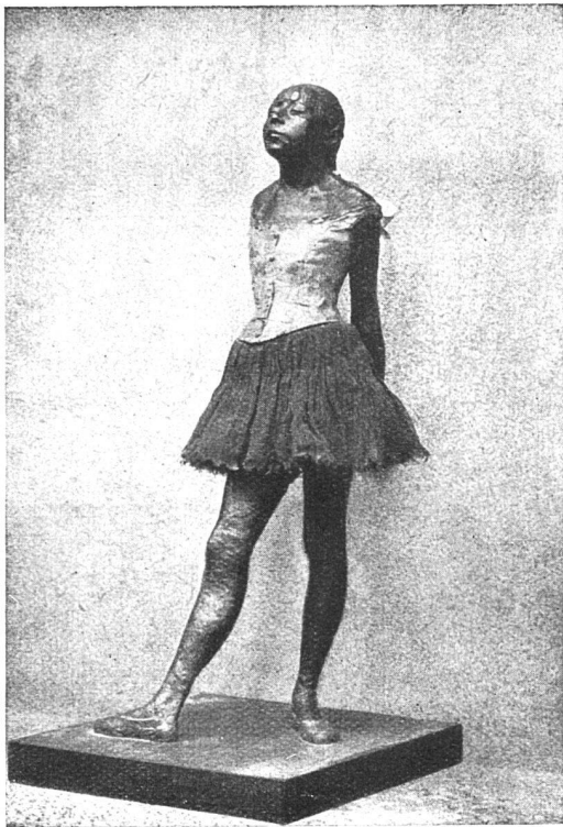
Edgar Degas / Tänzerin mit dem Tüllkleid