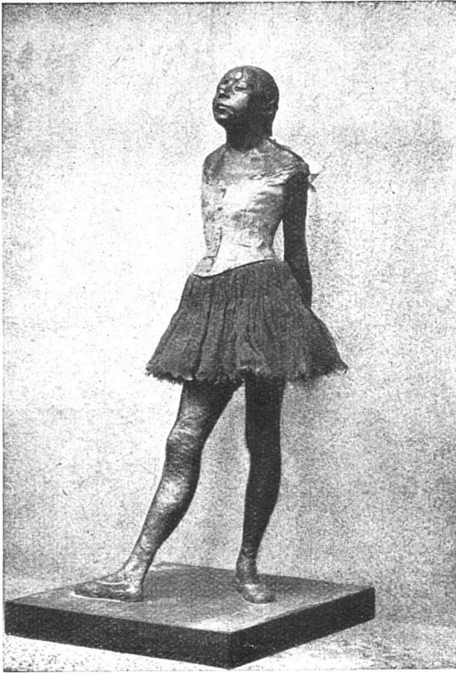
Edgar Degas / Tänzerin mit dem Tüllkleid