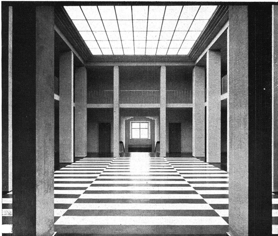
FAHNENHALLE DES STABSHAUSES / ARCHITEKT PROF. O. R. SALVISBERG B. S. A.