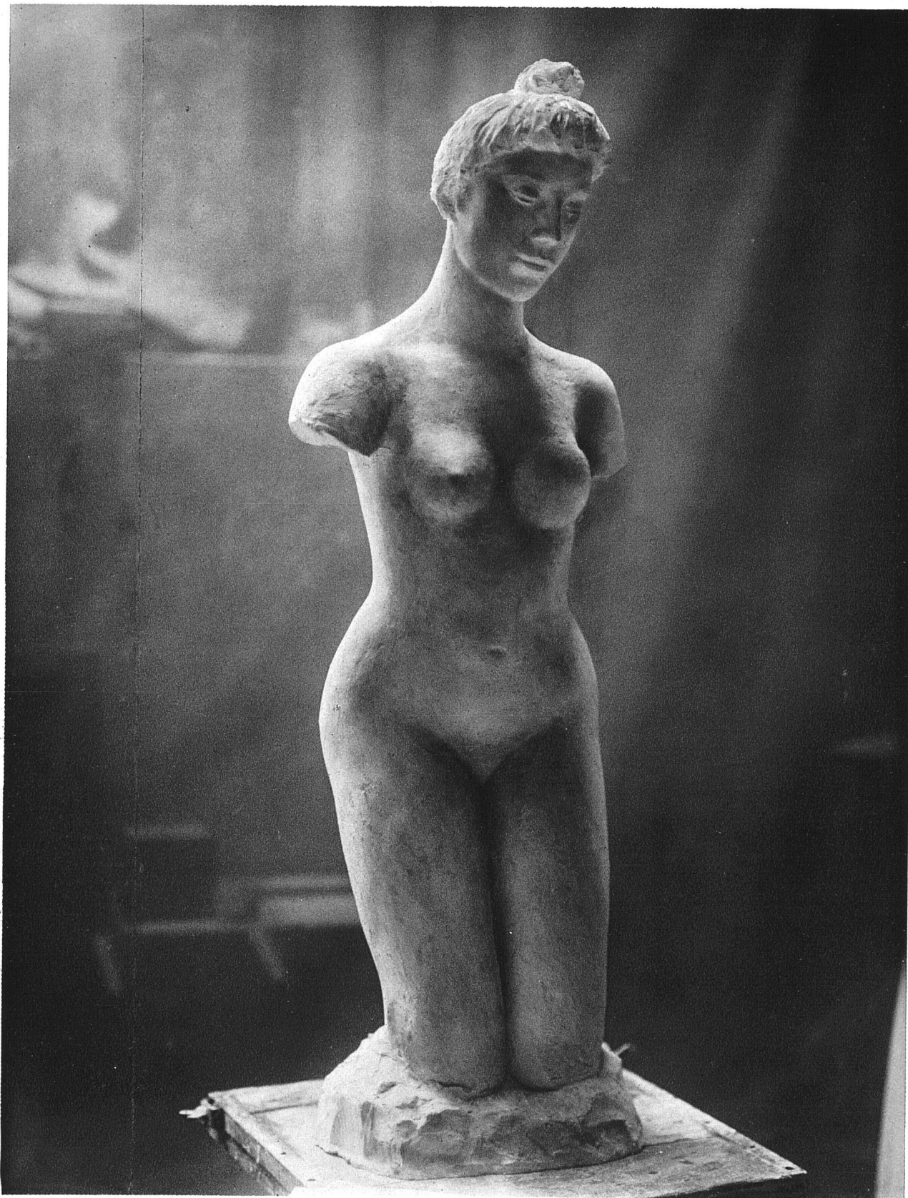
HERMANN HUBACHER / TORSO / Lebensgross