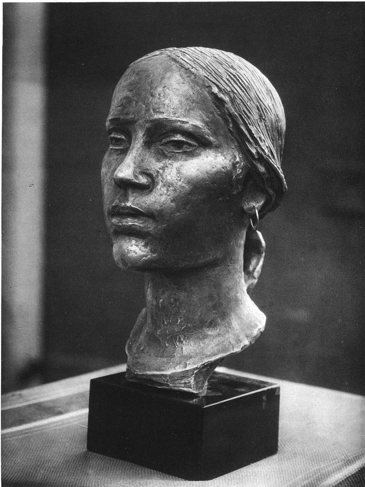
HERMANN HUBACHER / SIAMESIN / Bronze