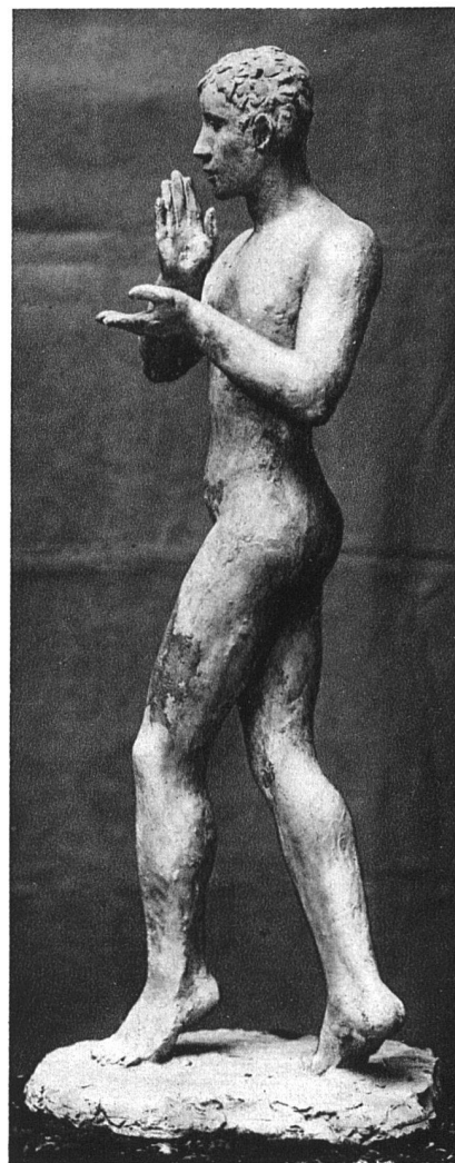
HERMANN HUBACHER / TÄNZER Bronze, 1 m hoch