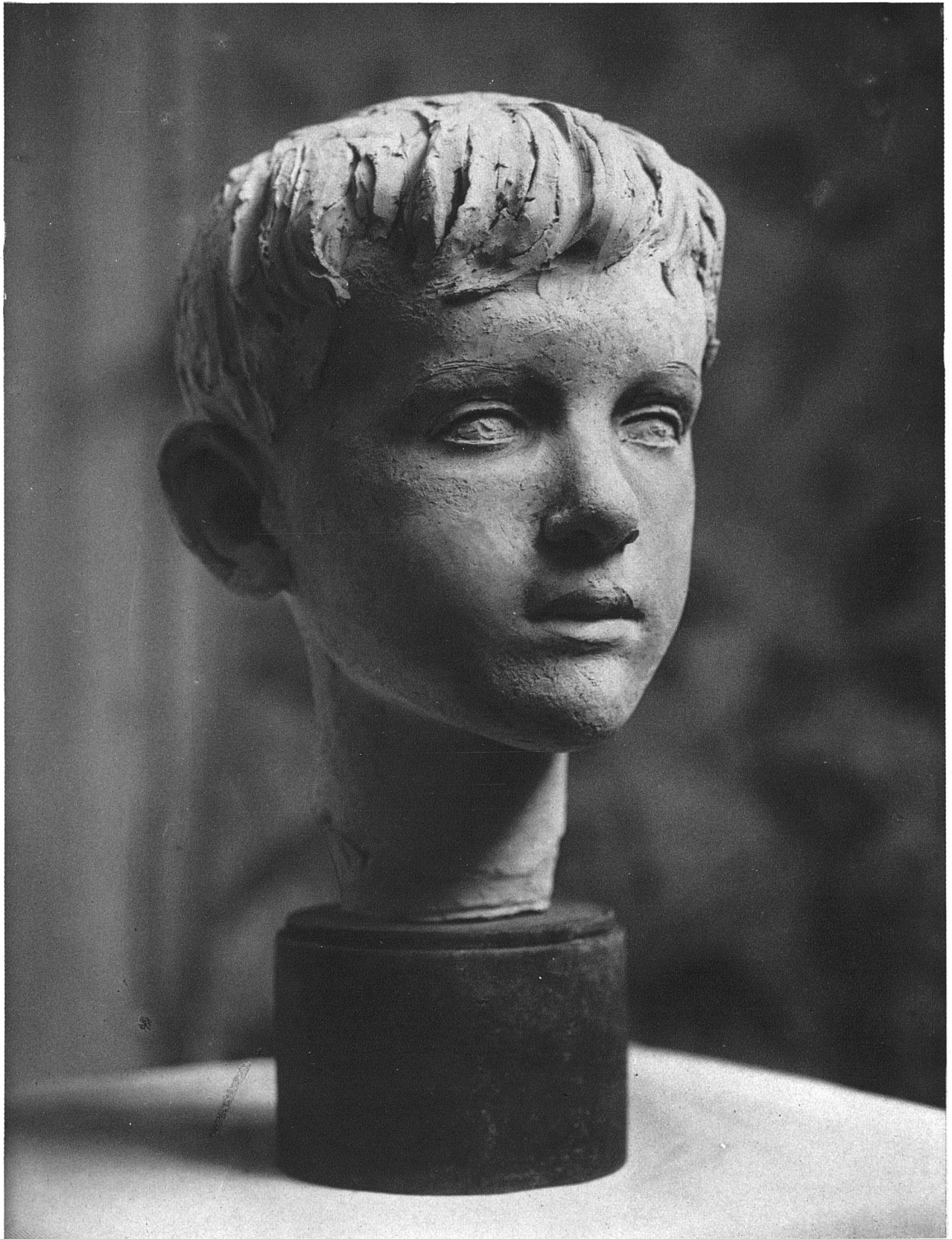
HERMANN HUBACHER / KNABENPORTRÄT / Terracotta / Privatbesitz