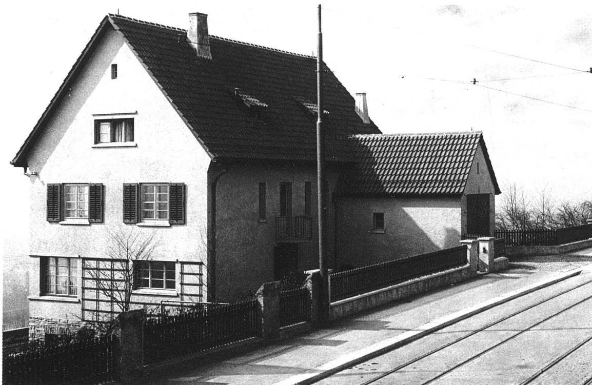
HAUS SCHNETZER-MEIER, HÖNGG / ZUGANGSSEITE DES HAUSES