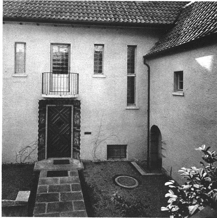
HAUS SCHNETZER-MEIER, HÖNGG / DER TIEFLIEGENDE HAUPTINGANG