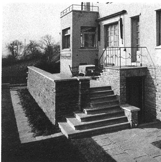
GARTENAUFGANG AUF DER SÜDSEITE DES HAUSES

Das Haus Schnetzer-Meier in Höngg liegt an dem steilen Ufer der Limmat bei Höngg, dicht unterhalb der Landstrasse Zürich-Wettingen. Der Bauplatz verlangte für den Zugang im tiefliegenden Erdgeschoss, und für die Garage auf Strassenniveau in Höhe des Obergeschosses, besondere Dispositionen. Das Haus hat einen guten Ausbau erfahren, Zentralheizung mit Warmwasseranlage, Kalt- und Warmwasser in allen Schlafzimmern. Die Bauzeit ist 1927/28. Die reinen Baukosten betragen für den Kubikmeter des umbauten Raumes Fr. 63.50.