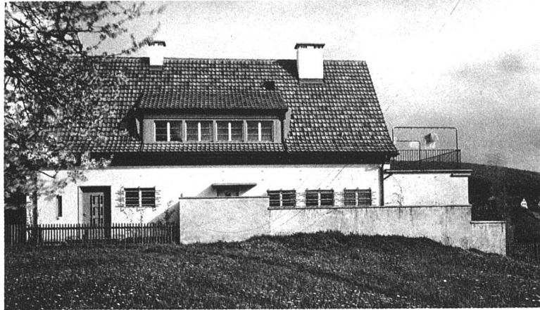
oben: NORDWESTSEITE unten: SÜDOSTSEITE DES HAUSES