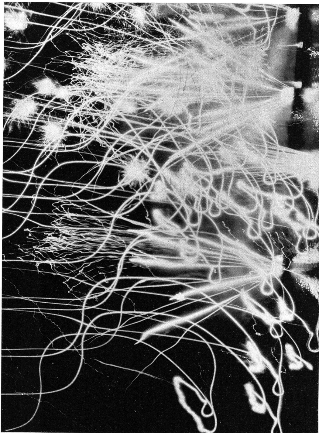
AENNE BIERMANN, GERA FEUERWERK AUF DEM VIERWALDSTÄTTERSEE