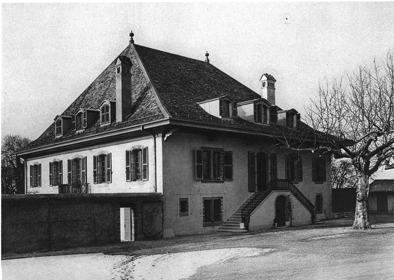
DOMAINE DE MERLINGE / APRÈS LA RESTAURATION PAR MAURICE TURRETTINI, ARCH. F. A. S.