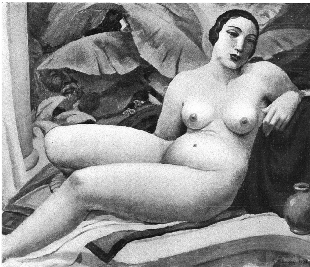
GUSTAVE FRANÇOIS / SUZANNE (HUILE) / VERSION 1928 / 130/110 cm