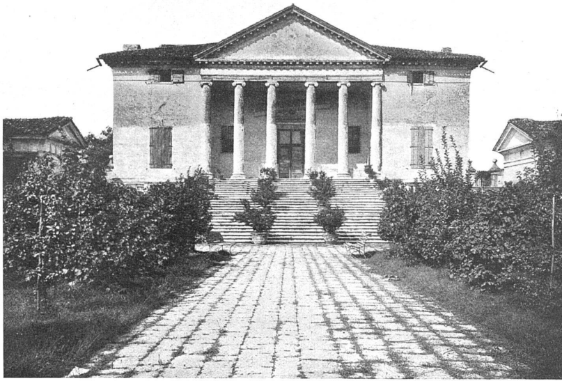
PALLADIO / VILLA BADOER A FRATTA POLESINE / FAÇADE PRINCIPALE D'après une héliogravure des éditions A. Morancé, Paris