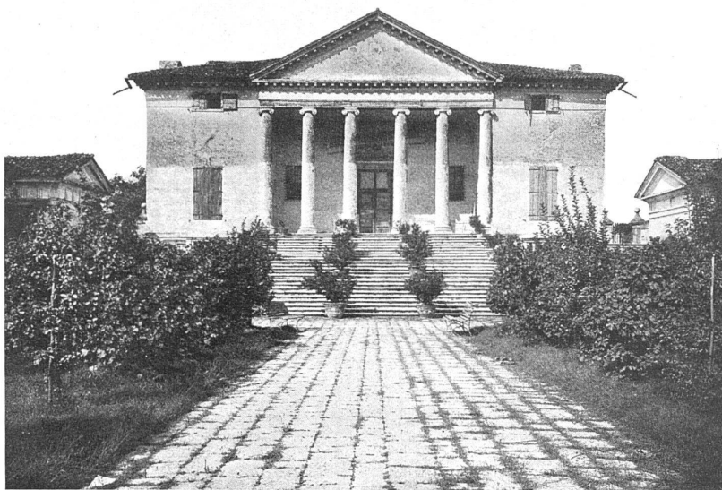
PALLADIO / VILLA BADOER A FRATTA POLESINE / FAÇADE PRINCIPALE D'après une héliogravure des éditions A. Morancé, Paris