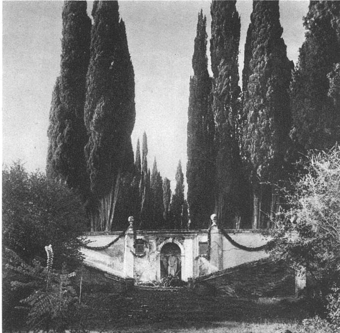
VILLA FALCONIERI IN FRASCATI