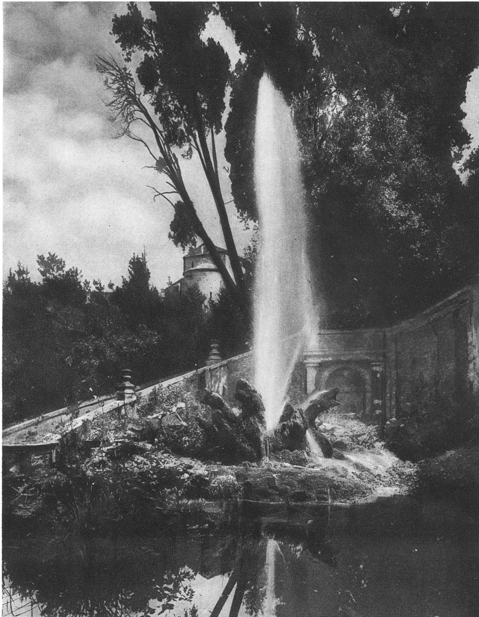
VILLA D'ESTE IN TIVOLI

macht, ist eben, dass auch an ihnen kein Haarbrett Willkürliches war: »Nur dass sie die Grenzen und Gesetze ihrer Kunst im höchsten Grade kannten und mit Leichtigkeit sich darin bewegten, sie ausübten, macht sie so gross.«