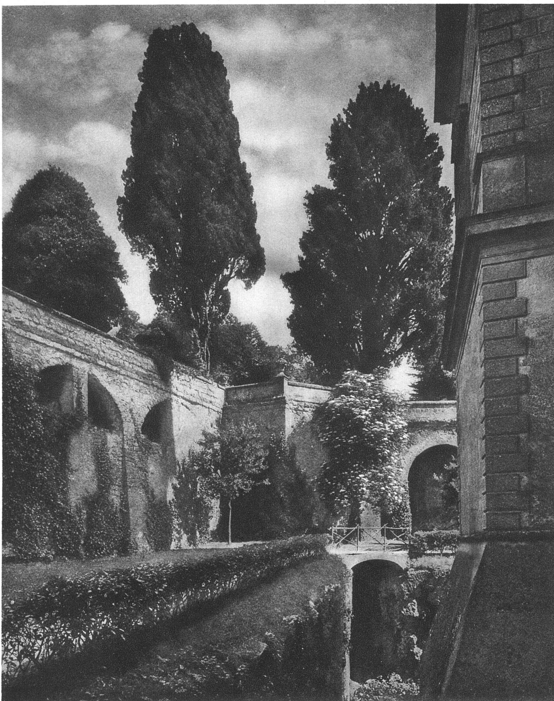
PALAZZO FARNESE IN CAPRAROLA