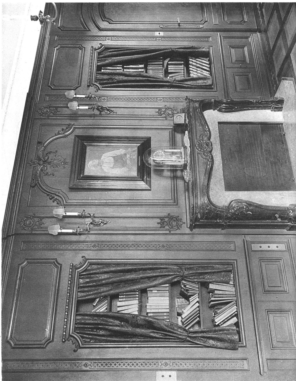
Intérieur aus einer Villa in Zürich