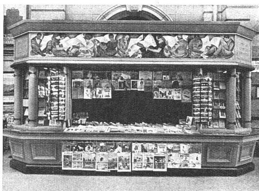
Der neue Zeitungskiosk im Bahnhof Luzern

Die Librairie-Edition S.A. vorm. F. Zahn in Bern beauftragte die Architekturfirma C. Griot u. Sohn mit der Lösung der Aufgabe. In welcher Weise dies geschehen ist, zeigt die beistehende Abbildung. Bücher und Zeitschriften in der Auslage sprechen als farbige Reklame selber. Der Farbton des Holzwerkes ist grau mit grüner Patinierung. Der farbige Fries von Kunstmaler Prof.