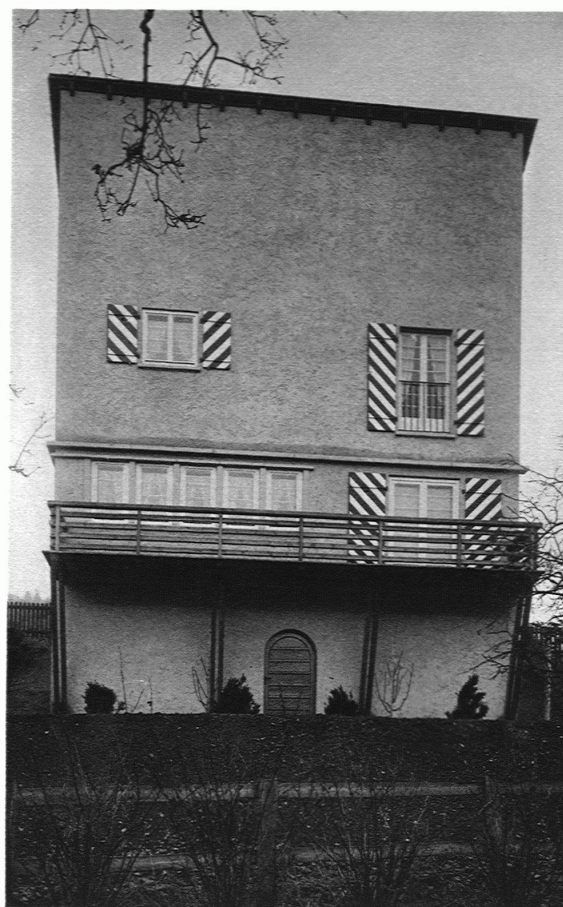
HAUS EGENDER / GARTENSEITE